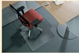
Lieferung ohne Deko