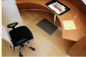
Lieferung ohne Deko